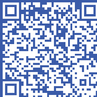
Короткометражные фильмы, которые можно посмотреть на профилактическом занятии 2 часть