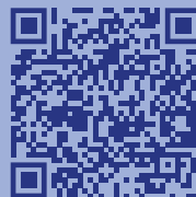
Материалы по профилактике экстремизма