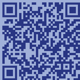
Материалы для проведения квеста