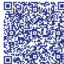
Группа в социальной сети «ВКонтакте»

Работы участников размещены в группе в социальных сетях, с ними можно ознакомиться, перейдя по ссылке