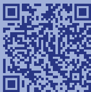
Видеоролики по профилактике экстремизма