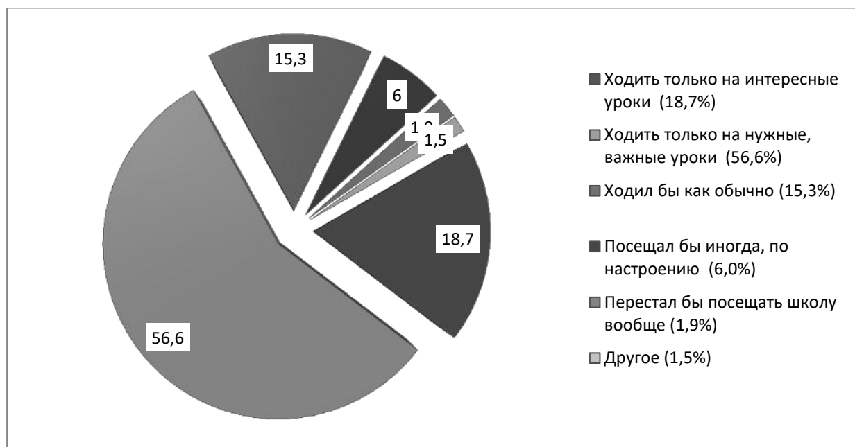
Рис.1. Распределение ответов на вопрос: «Если бы у вас была возможность выбирать, что бы вы предпочли?»

На вопрос: «Если бы у вас была возможность выбирать, что бы вы предпочли?», ответы распределились следующим образом: