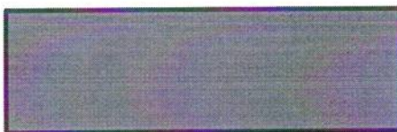
Рисунок 1. Схема подвески

Подвеска автомобиля играет роль соединительного звена между кузовом автомобиля и дорожным покрытием [1, С. 5-15]. В современных автомобилях каждую из функций подвески выполняет отдельный конструктивный элемент [2]. ... Схема разработанной мной подвески представлена на рисунке 1.