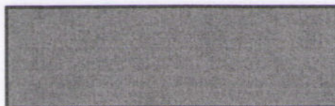
Рисунок 1. Схема подвески

Подвеска автомобиля играет роль соединительного звена между кузовом автомобиля и дорожным покрытием [1, С. 5-15]. В современных автомобилях каждую из функций подвески выполняет отдельный конструктивный элемент [2]. ... Схема разработанной мной подвески представлена на рисунке 1.